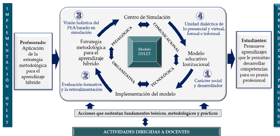
Figura 1. Modelo HyLE

En la Figura 1 se muestra un esquema del modelo de aprendizaje híbrido denominado HyLET ( Hybrid learning emergency technology ), diseñado para el Centro de simulación de la UCSG por uno de los autores de esta investigación.