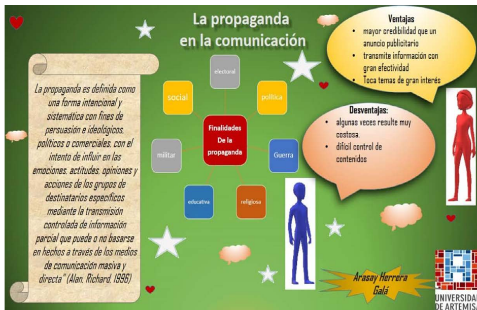
Figura 4. Asignatura Comunicación y Educación

Los autores consideran que el aprendizaje derivado de esta actividad evaluativa cumple con lo expresado por Gramsci en (Apud, 1981), donde manifiesta que el modo de ser del intelectual no puede seguir consistiendo en la elocuencia sino en la participación activa en la