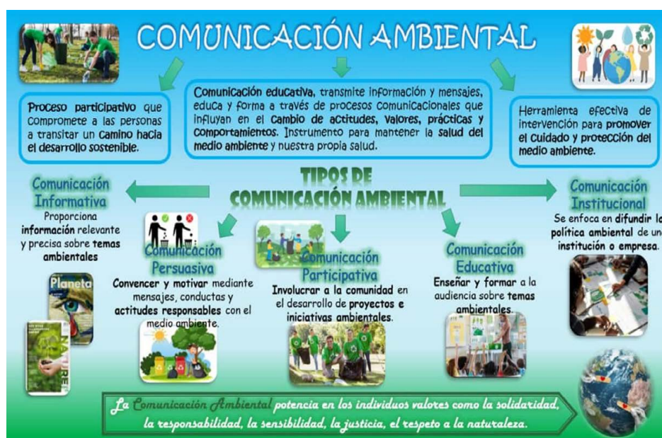
Figura 3. Asignatura Comunicación y Educación