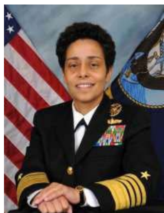
Figura 5. ALM Michelle J. Howard, la primera Mujer en alcanzar el grado de Almirante de cuatro estrellas en la US Navy.

No se trata de una guerra de sexos ni nada que se le parezca, es más bien una suerte de evolución sociológica que debe tomar un tiempo normal de desarrollo, puesto que a diferencia de cualquier otro grupo social, no se puede contratar a través de anuncios en el periódico a un Almirante o un Contraalmirante, el único camino para que alguien ocupe estos cargos será una carrera naval establecida por medio de evaluaciones, cursos y promociones. El hecho que una mujer llegue a ocupar alguna vez una de estas jerarquías, dependerá de sus capacidades y para nada de su género (ver Figura 5).