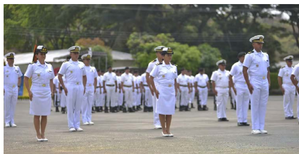
Figura 1. Graduación del curso de “Salto Libre” en el Cuerpo de Infantería de Marina”

las de Canadá han comprobado que en las mujeres en combate pueden tener un comportamiento tan o más duro como los hombres y que la sociedad canadiense aceptaba fácilmente la noticia de una mujer soldado 3 . La única verdadera barrera a la participación de las mujeres en el combate ha sido la resistencia masculina de un grupo social muy cohesionado. (ver Figura 1)