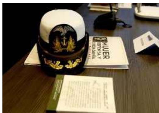
Figura 3. El rol de la mujer en la Armada.

Sin embargo, este proceso de transformación también impactó a los hombres, pues, la incorporación femenina trajo consigo un proceso de adaptación por parte del personal masculino, que vio modificadas dinámicas tradicionales dentro de su entorno profesional. En algunos casos, esta transición generó mecanismos de reajuste organizacional orientados a redefinir roles y espacios; en otros, se evidenciaron resistencias culturales propias de estructuras históricamente configuradas bajo una lógica predominantemente masculina. Al final del día, tanto hombres como mujeres tratan de adaptar y adoptar sus posiciones y se entregan miembros femeninos a la sociedad militar (ver Figura 3).